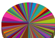
Quantidade de preços por item