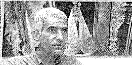
Salame também anunciou versão infantil do Livro das Peregrinações

As ações da Diretoria da Festa têm como foco a evan-