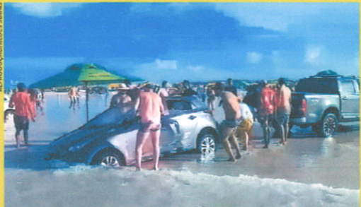
Pelo menos sete veículos ficaram atolados na areia da praia