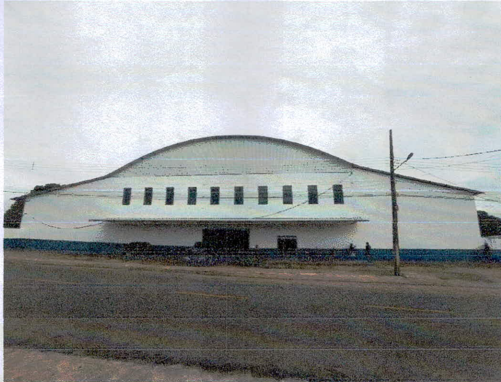
Figura 1 - Fachada Principal.