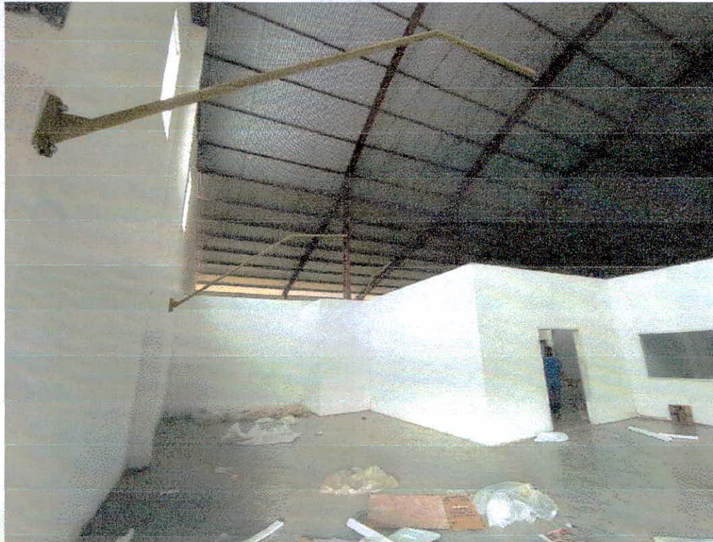
Figura 3 - Galpão que sediará o complexo municipal educacional de ensino infantil e fundamental.