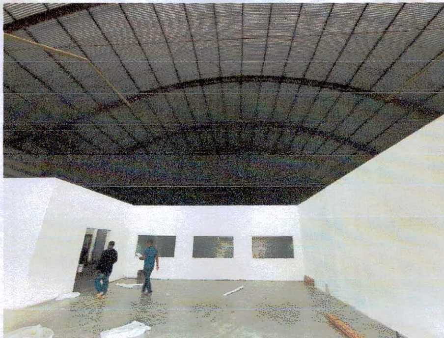
Figura 2 – Galpão que sediará o complexo municipal educacional de ensino infantil e fundamental.