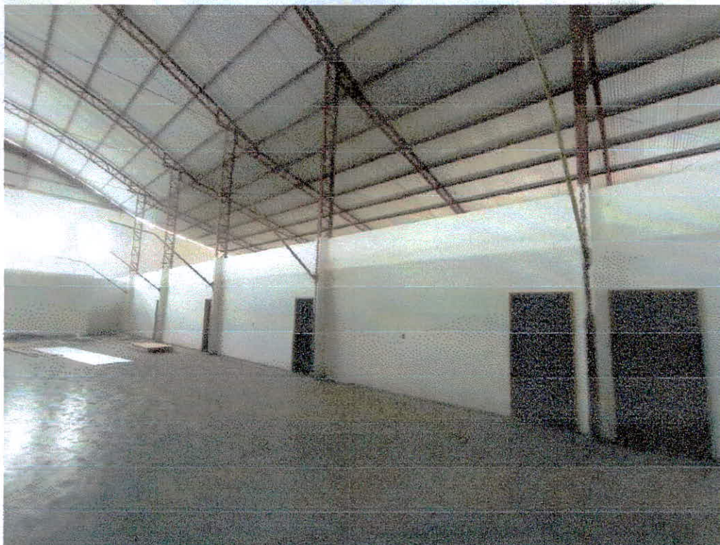
Figura 4 – Galpão que sediará o complexo municipal educacional de ensino infantil e fundamental.