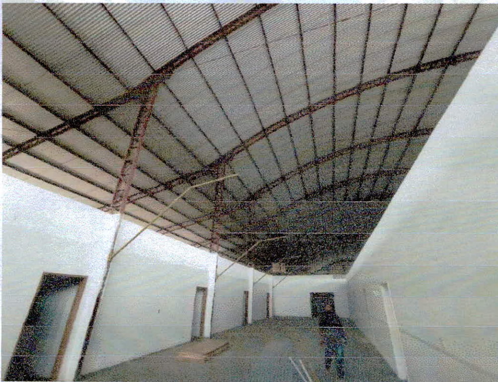
Figura 6 – Galpão que sediará o complexo municipal educacional de ensino infantil e fundamental.