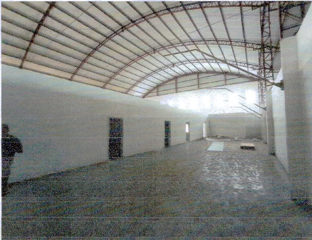
Figura 5 – Galpão que sediará o complexo municipal educacional de ensino infantil e fundamental.